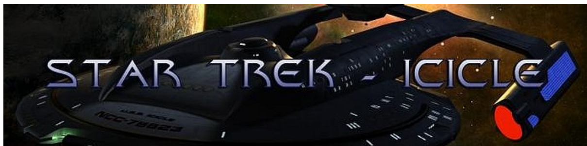
STAR TREK - ICICLE