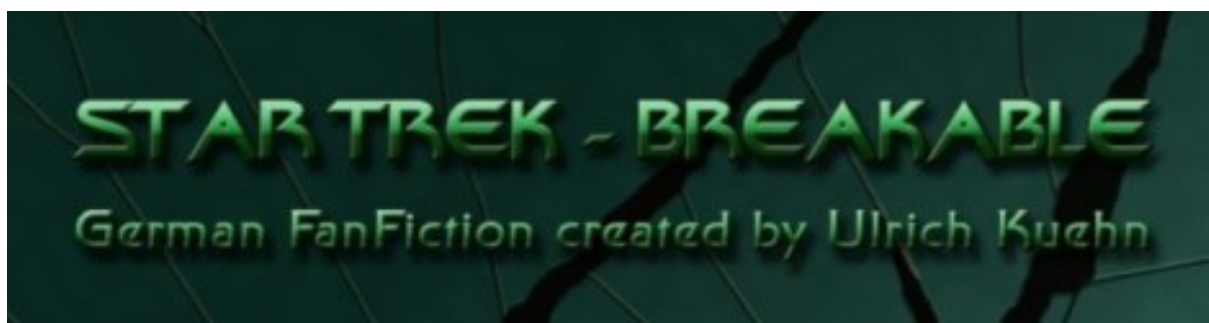
STAR TREK - BREAKABLE