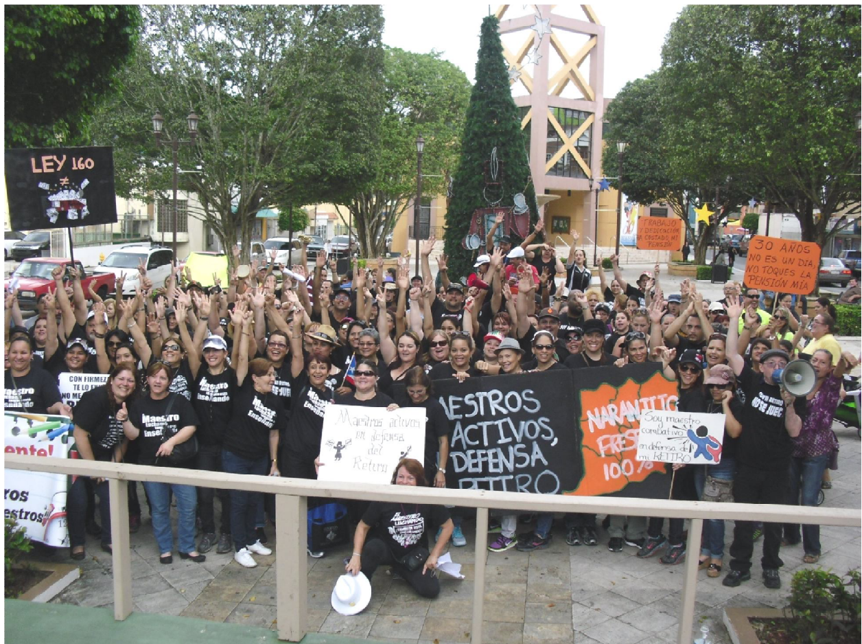
Maestros de Naranjito en la Plaza Pública al concluir primer día del paro

"No hay triunfo sin lucha, ni lucha sin sacrificio"