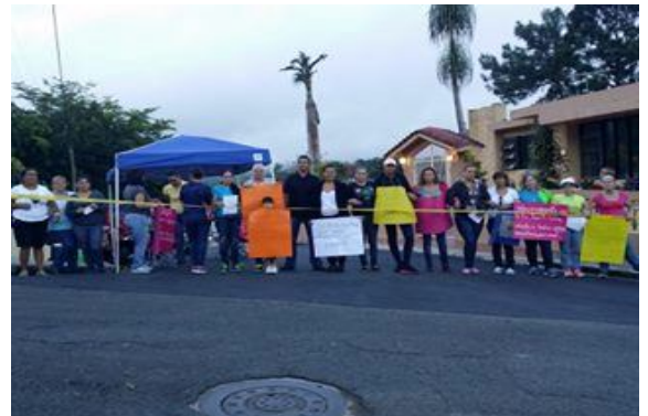
Comunidad y maestros defendiendo la Esc. José E. Colón de Barranquitas, septiembre 2014

El primer culpable es el gobierno estadounidense por su injerencia en nuestro sistema educativo. Imponen criterios y filosofía educativa ajena a nuestra idiosincrasia. Cosas como No Child Left Behind (NCLB – 2001), pruebas estandarizadas (PPAA), hechas para que las metas de las escuelas sean aprobar las mismas pero que están diseñadas para que se fracase. Su visión no es crear estudiantes con pensamiento crítico. Peor, ni siquiera son un buen modelo educativo. El Programa for International Student Assessment (PISA) en el 2012 clasificó a los Estados Unidos, número 38 en la lista de 66 países, 36 en matemáticas, 28 en ciencia y 24 en lectura entre los países desarrollados.