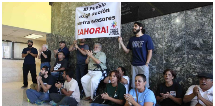
El pueblo exigiendo a Hacienda que le meta mano a los verdaderos evasores, las compañías foráneas y ricos. 19 marzo de 2015.

En toda la discusión sobre el IVA el gobierno ha insistido en que la única solución a la crisis fiscal es la de ellos. Usted escucha constantemente al gobernador colonial de turno y legisladores de la mayoría decir que las personas que se oponen no presentan o tienen propuestas. Lo dicen por dos razones, primero porque ellos son intermediarios de los bonistas y segundo porque menosprecian al pueblo. Para ellos lo que usted diga no es importante solo lo que ellos dicen o creen vale.