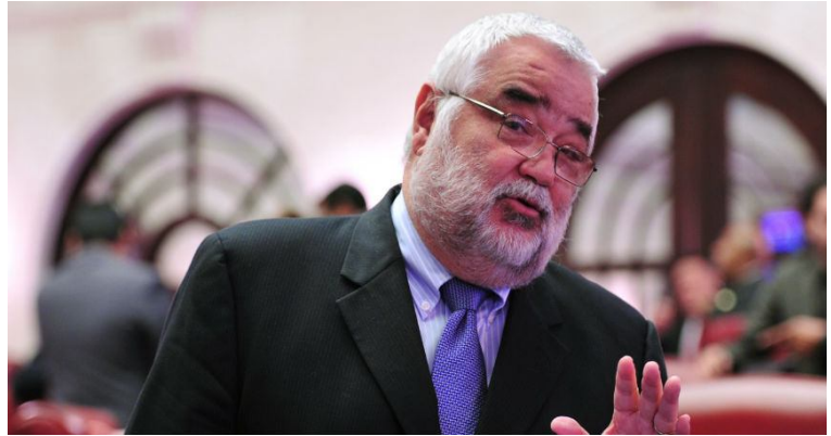
Miguel A. Pereira Castillo, senador PPD, 4 años en el senado, ingresos $292,000 dólares.

Ahora reflexione usted, que cosa han hecho para mejorar la calidad de vida y economía en tu comunidad o barrio. ¿Qué hacen para mejorar la escuela pública, el sistema de salud, crear empleos, proteger al pueblo?