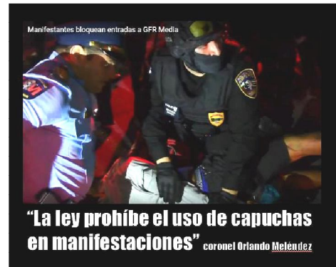
Manifestantes bloquean entradas a GFR Media