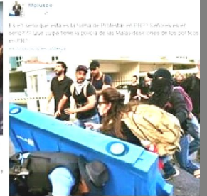
Manifestantes contra la Junta paralizan entrada del Círculo Plaza El día sábado en el Colegio de Abogados - Abogados de Puerto Rico https://www.instagram.com/...