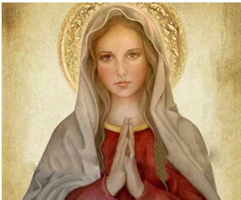
MẸ CẦU NGUYỆN trước & sau ngày truyền tin

MÙA VỌNG bắt đầu tuần tới Chúa Nhật 27-11-2016 là thời gian của HỒNG ÂN cho toàn thể nhân loại và cho mỗi người chúng ta: Thiên Chúa ĐẾN thăm, cứu độ, yêu thương, chữa lành, làm cho sống..! Ngài ĐÃ đến hơn 2000 năm trước! Ngài ĐANG đến hằng giây phút hôm nay để thực hiện mục đích đó. Ngài chắc chắn SẼ đến trong ngày cuối cùng của thế giới. Việc ĐẾN, HIỆN DIỆN, VIẾNG THĂM của Thiên Chúa quả là một hồng ân vĩ đại chỉ được BAN cho những ai khiêm tốn và liên li cầu nguyện như Mẹ!