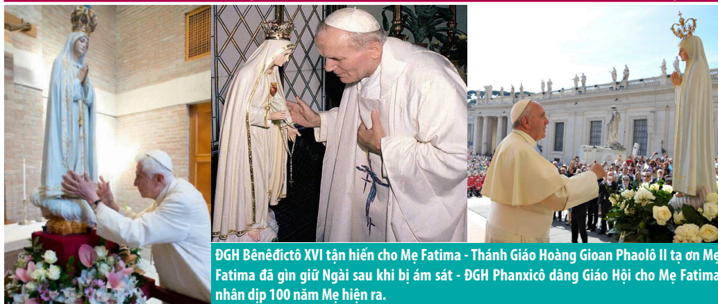
ĐGH Bênêđictô XVI tận hiến cho Mẹ Fatima - Thánh Giáo Hoàng Gioan Phaolô II tạ ơn Mẹ Fatima đã gìn giữ Ngài sau khi bị ám sát - ĐGH Phanxicô dâng Giáo Hội cho Mẹ Fatima nhân dịp 100 năm Mẹ hiện ra.

Tại sao cả ba vị Giáo hoàng đều quan tâm thực hiện ba mệnh lệnh Mẹ nhắn nhủ tại Fatima? Thưa vì các ngài đã thấy tầm quan trọng của sứ điệp Fatima có ảnh hưởng tới vận mệnh thế giới. Các ngài cũng đã tận mắt chứng kiến lời tiên báo cũng như lời hứa của Mẹ đã được thực hiện quá tỏ tường. Và đồng thời với cương vị lãnh đạo, với tầm nhìn toàn cầu và với trực giác thiêng liêng các ngài thấy tình hình thế giới vẫn mong manh nguy hiểm, sứ điệp của Mẹ vẫn còn nguyên tính chất thời sự. Vâng nghe lời Mẹ và hiệp thông với 3 vị Giáo Hoàng, Cộng Đoàn dành tháng Mân Côi để thực hiện 3 mệnh lệnh của Mẹ Fatima: 1. Cải thiện đời sống - 2. Năng lần hạt Mân Côi - 3. Tôn sùng đền tạ Trái Tim Mẹ.