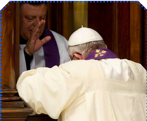
ĐGH Phanxicô nhận bí tích hòa giải hàng tuần