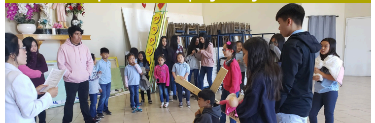
Ca Đoàn Đaminh Saviô diễn tập Đàng Thánh Giá