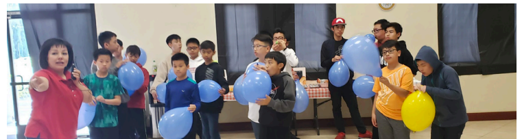
Buổi sinh hoạt của Ban Giúp Lễ