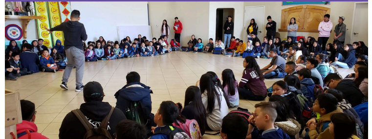
Các em lớp Huấn Giáo & Việt Ngữ mừng lễ Don Bosco