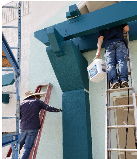
Các anh em BCH và Ban Xây Dựng dọn dẹp, sơn sửa Trung Tâm chuẩn bị HẬU ĐẠI DỊCH.