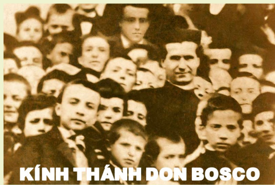
KÍNH THÁNH DON BOSCO

Lạy thánh Don Bosco, Chúa đã làm cho ngài trở nên người giáo dục đại tài lớp trẻ, chúng con xin Ngài hướng dẫn và nâng đỡ con cháu và mọi giới trẻ trong Cộng Đoàn.