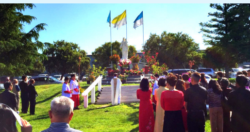
Cộng Đoàn quây quần bên MẸ mỗi cuối tuần