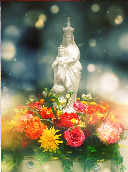
Kiểu "Đức Bà Phù Hộ" suốt tháng Hoa