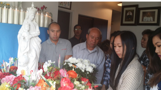
Gia đình quây quần bên MẸ trong tháng Hoa

"Rước Mẹ Về Nhà" - MẸ ơi, suốt tháng Hoa chúng con mời Mẹ về thăm gia đình chúng con. Kết tháng Hoa, chúng con xin Mẹ ở lại để hướng dẫn và ban ơn phù trì gia đình chúng con được luôn sống là người con hiếu thảo của Mẹ và dẫn mọi người trong gia đình chúng con đến với Chúa Giêsu con Mẹ. Chúng con tạ ơn Mẹ với tất cả tâm lòng con thảo của chúng con, Mẹ nhé!